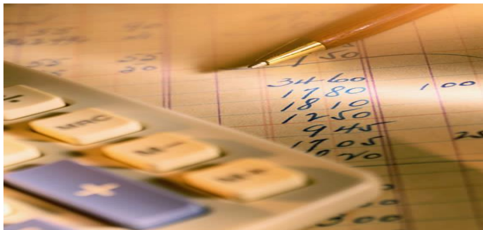
Figure 5. Ndikimi i auditmit finciar

Auditimet financiare - kryhen për të vlerësuar saktësinë dhe plotësinë e regjistrimeve dhe gjendjeve të llogarive. Auditimet financiare përcaktojnë nëse informacioni financiar i subjektit publik paraqet në mënyrë të besueshme pozitën financiare, rezultatet e operacioneve dhe shmangiet e subjektit të audituar në përputhje me Standardet Ndërkombëtare të Kontabilitetit Publik.