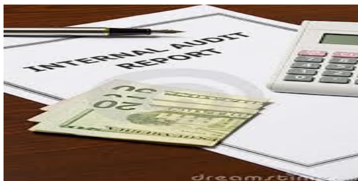
Figure 2. Raporti I Auditimit Brendshëm

Në Janar 2003 përfundoi rishikimin e dytë të Praktikave profesionale të auditimit të brendshëm dhe në Janar 2004 ato u mandatuan si standarde të reja. Referuar ndryshimeve që pësuan këto standarde në vitin 2004 Auditimi i brendshëm, është përkufizuar si më poshtë: “Auditimi i brendshëm është veprimtari e pavarur, që jep siguri objektive dhe këshilla për drejtimin, i projektuar për të shtuar vlerën dhe përmirësuar veprimet e subjektit publik. Ai ndihmon subjektin me anë të një mënyre sistematike dhe të disiplinuar për të vlerësuar dhe përmirësuar frytshmërinë e menaxhimit të riskut, proceset e kontrollit dhe të qeverisjes/drejtimit ”Nga sa më lart rezulton se ky shërbim përfaqëson një veprimtari të pavarur, e cila i bashkëlidhet (ofrohet) menaxhimit të lartë të qendrës shpenzuese përkatëse për të vlerësuar cilësinë dhe efikasitetin e sistemeve të kontrollit dhe menaxhimit financiar, për të bërë rekomandime që përmirësojnë këto sisteme.” 2